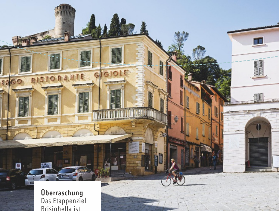
Überraschung Das Etappenziel Brisighella ist unerwartet hübsch