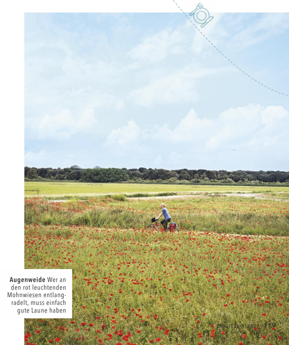
Augenweide Wer an den rot leuchtenden Mohnwiesen entlangradelt, muss einfach gute Laune haben