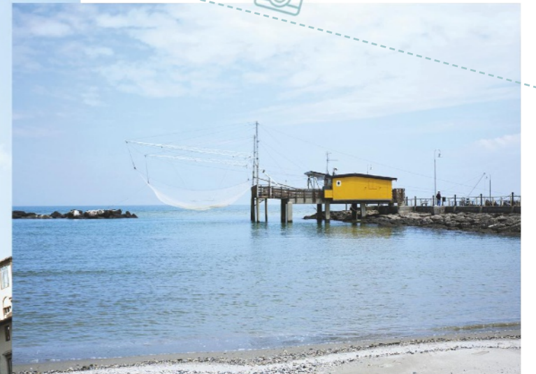
Im Netz Fischerhütten auf Stelzen an der Lagune von Comacchio