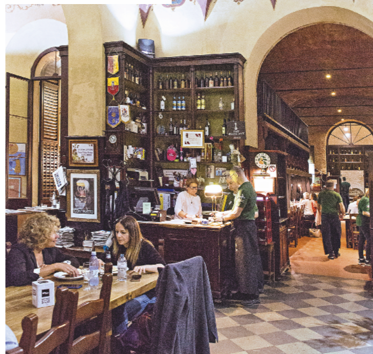
Fresstempel Das Restaurant „Ca’ De Ven“ in Ravenna lohnt wegen des Essens und der Atmosphäre