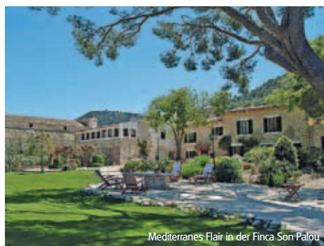
Mediterranes Flair in der Finca Son Palou

Hinweis: Sollte eine Unterkunft nicht verfügbar sein, wird alternativ eine Unterkunft gleichwertiger Kategorie gebucht.