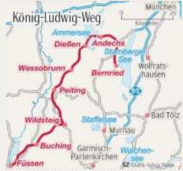
■ Die Reise wurde unterstützt von Eurofun Touristik GmbH.