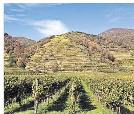
Wachau und Wein – das passt immer.

Und Steig ist wahrlich passend gewählt. Zum Einstieg in die Tour ist eine enorme Steigung zu nehmen. Von Krems über Stein bis zur Donauwarte geht es stetig die Weinberge hoch, nicht nur im Sommer eine schweißtreibende Angelegenheit, die allerdings auch mit einer fantastischen Aussicht vom Türmchen belohnt wird. Etwas, woran man sich schnell gewöhnt, denn immer wieder geben die Wälder den Blick aufs tiefliegende Donautal frei. Und so scheint es zunächst völlig überflüssig, für einen weiteren Aussichtspunkt einen 20-Minuten-Umweg zu machen. Doch diese