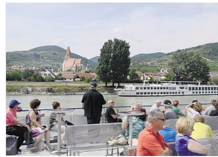
Schiffstouristen sind mit Wandergeschichten schnell zu beeindrucken.

explizite Empfehlung des Wanderbilderbuchs ist ein Extralob wert. Schließlich taucht hinter ein paar Bäumchen plötzlich die Dürnsteiner Kanzel, ein Felsvorsprung exakt 521 Meter über Seehöhe, auf und schenkt den spektakulärsten Fernblick der ganzen Wachau. Selbst von Deck des Donauschiffes macht diese Kanzel richtig was her. Die Damen nicken beeindruckt, der kalte Kaffee wird abergeräumt.