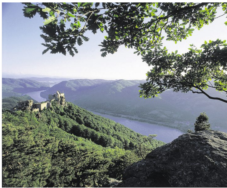
Spektakuläre Aussicht: Hoch über dem Donautal thront die Ruine Aggstein.

Gute Schuhe sind also wichtig, genauso wie gute Augen. Denn wer will sich schon gern verlaufen. Wer die Strecke von Krems nach Melk mit einem Anbieter wie Eurohike zurücklegt, genießt einen Rundumsorglos-Service – mit vorab gebuchten Hotelzimmern, Koffertransport von einem Haus zum nächsten und einem Touren-